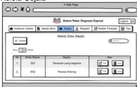
Gambar 4. Interface Design Halaman Kelola Gejala