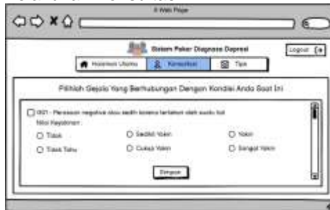
Gambar 7. Interface Design Halaman Melakukan Konsultasi