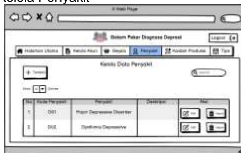
Gambar 5. Interface Design Halaman Kelola Penyakit