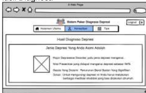
Gambar 8. Interface Design Halaman Hasil Diagnosa