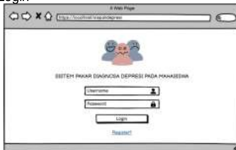
Gambar 3. Interface Design Halaman Login