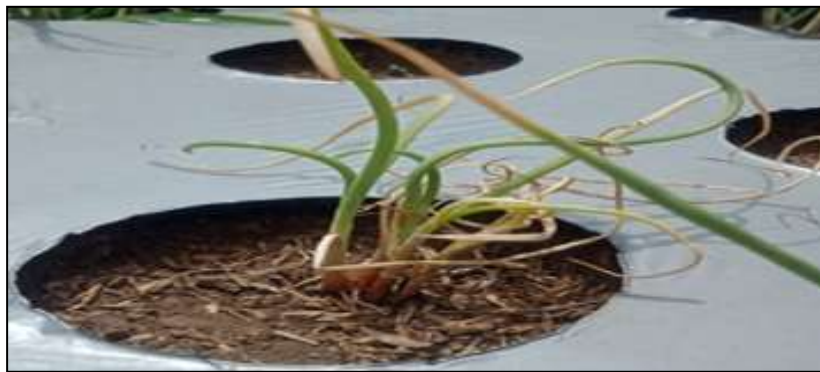
Gambar 3. Gejala Moler pada Varietas Trisula.

Gejala Moler memperlihatkan ciri yang khas yaitu warna daun menjadi kuning dan bentuknya melengkung terpelintir. Hal ini menyebabkan tanaman menjadi cepat layu, kurus kekuningan dan terkulai seperti akan roboh. Pada bagian dasar umbi lapis terlihat koloni cendawan berwarna putih dan apabila dipotong membujur maka terlihat adanya pembusukan yang berawal dari dasar umbi meluas ke atas maupun ke samping (Gambar 3). Gejala dan tanda ini hanya terdapat pada varietas bawang merah Trisula.