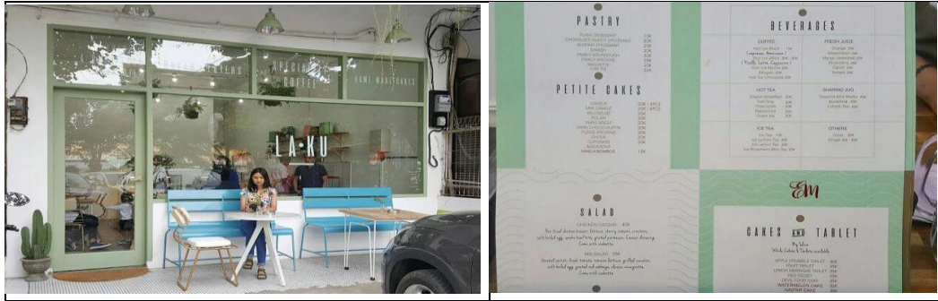
Gambar 3. Perbaikan industri roti.

Melalui perencanaan dan rancang bangun pada proses produksi roti dan beberapa mesin/peralatan, diharapkan mampu meningkatkan kualitas produk, efisiensi produksi serta keamanan pangan. Selain itu juga dengan adanya SOP tersebut diharapkan akan memudahkan tahapan kerja para pekerja pabrik dan menstandarkan tahap operasional mesin/peralatan serta menghindari kerusakan dini pada peralatan tersebut. Perencanaan perbaikan layout mesin/peralatan yang bisa digunakan sebagai acuan perbaikan penyusunan tata letak mesin/peralatan dimasa mendatang, agar dihasilkan waktu produksi yang seefisien mungkin.