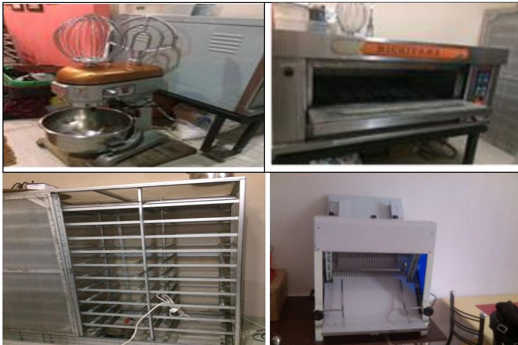
Gambar 2. Peralatan utama proses pengolahan roti.

Perancangan tata letak industri roti harus sesuai dengan alur proses sehingga dalam menjaga higienis bahan baku hingga produk terjamin keamanannya. Tata letak proses pengolahan dapat dilihat pada gambar 5. Tata letak alat harus berdasarkan pada kapasitas mesin, kecepatan proses dan hasil produk roti yang terjamin keamanannya. Selain itu keamanan dan kenyamanan karyawan harus menjadi pertimbangan sehingga pengawasan dapat dilakukan dengan baik. Peralatan yang dipakai dalam industri roti ini terdiri atas beberapa peralatan utama yaitu mixing , proofing , oven dan bread slicer seperti pada gambar 2.